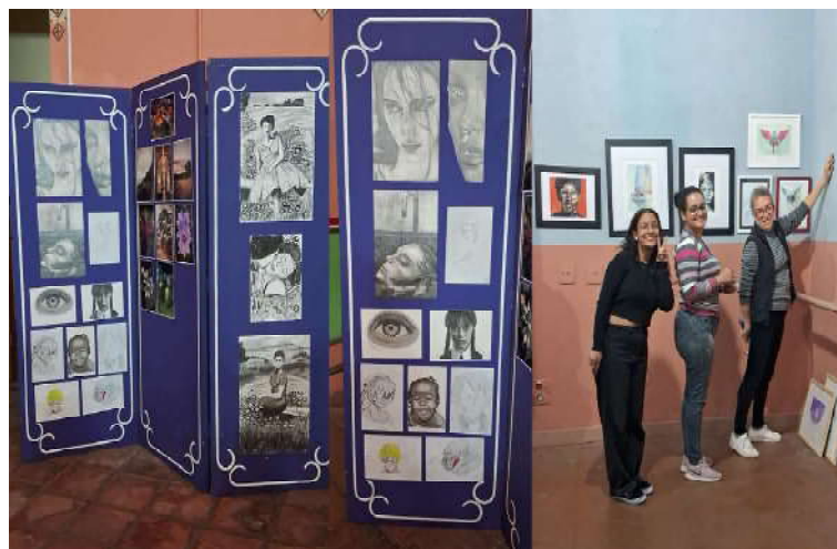
ALUNOS DO CURSO DE GRADUAÇÃO DE ARTES MONTAGEM DA EXPOSIÇÃO